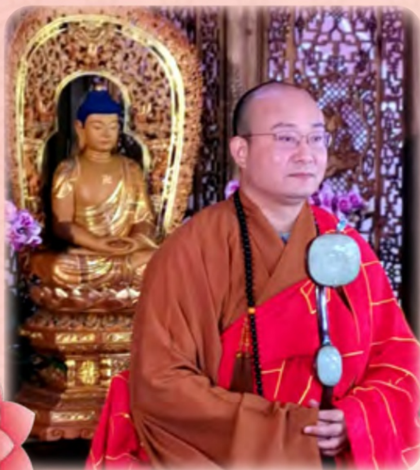
宏明法師倡導佛化婚姻的夫妻，要成為修行路上的良師益友，共同精進。